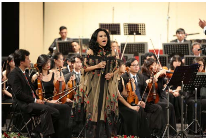
▲ Diva Thanh Lam