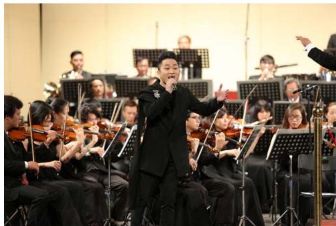
▲ Divo Tùng Dương